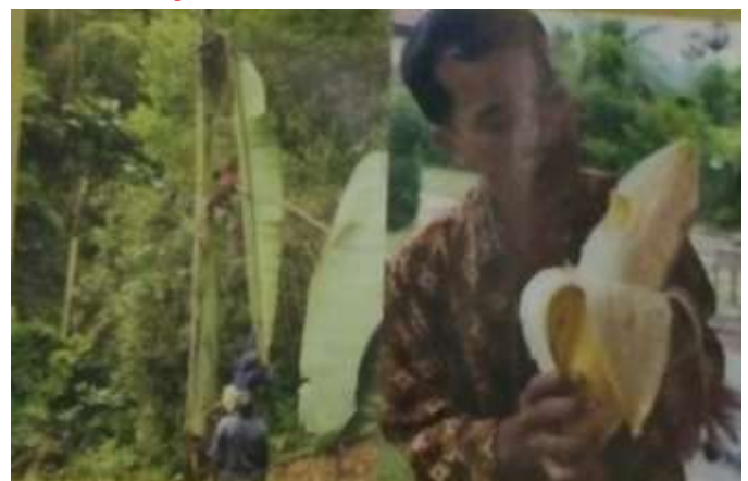
ലോകത്തിലെ ഏറ്റവും ഉയരമുള്ള വാഴയിനം മുസ ഇൻജൻസ്. ഇൻഡോനേഷ്യയിലും പാപ്പു ന്യൂ

ലോകത്തിലെ ഏറ്റവും ഉയരമുള്ള വാഴയിനം മുസ ഇൻജൻസ്