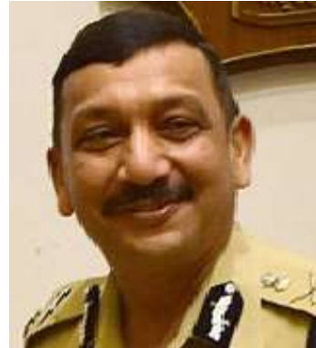
ശ്രീ. സുബോദ് കുമാർ ജയ്സാൾ

പുതിയ സിബിഐ ഡയറക്ടറായി ജയ്സാൾ. സെൻട്രൽ ബ്യൂറോ ഓഫ് ഇൻവെസ്റ്റിഗേഷന്റെ (സിബിഐ) പുതിയ ഡയറക്ടറായി സുബോദ് കുമാർ ജയ്സാളിനെ നിയമിക്കാൻ തീരുമാനിച്ചു.