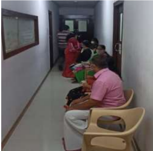
ഉഴവും കാത്ത് കൊവിഡ് പ്രൊട്ടോക്കോൾ പാലിച്ച അംഗങ്ങൾ