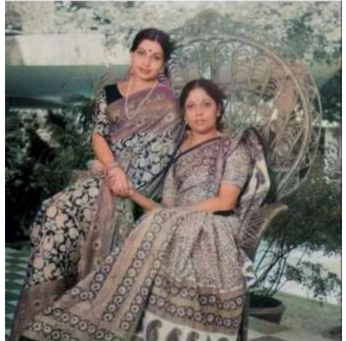
A rare photo of Jayalalita and our present Finance Minister Nirmala Sitharaman

ലോകത്തിലെ ഏറ്റവും ഉയരമുള്ള വാഴയിനം മുസ ഇൻജൻസ്