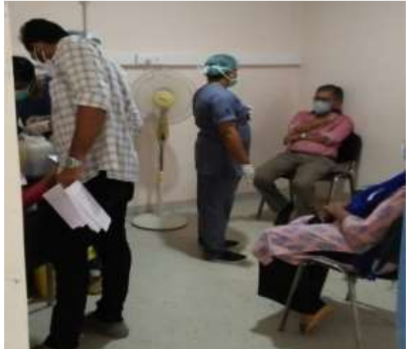
കുത്തിവയ്പ്പിന് ശേഷം അര മണിക്കൂർ നേരം കാത്തിരിക്കുന്നവരോട് അന്വേഷണങ്ങളുമായി സ്റ്റാഫ് നേഴ്സ്