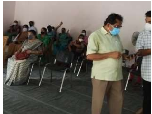
ഉഴവും കാത്ത് സാമൂഹ്യ അകലവും കൊവിഡ് പ്രൊട്ടോക്കോളും പാലിച്ച അംഗങ്ങൾ